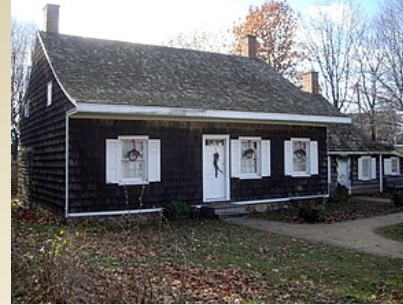
Будинок (із земельною ділянкою)*

*Якщо Ви купите приватний будинок, компенсація може надаватись і на придбання земельної ділянки, на якій розміщується будинок